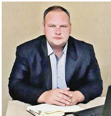
информационную и финансовую.

Центр предоставляет также услуги по микрофинансированию. Процентная ставка зависит от вида деятельности предпринимателя. Действует при центре и фонд залоговых гарантий. Но хочу отметить, что центр «Мой бизнес» и моздокский офис не работают за предпринимателя. Мы оказываем меры поддержки, которые можно разделить на две категории: